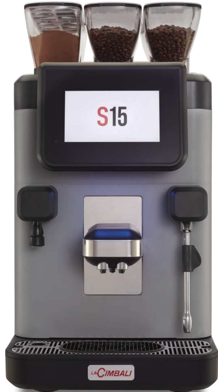
LaCimbali S15 – Vorderseite und ¾ Vorderansicht