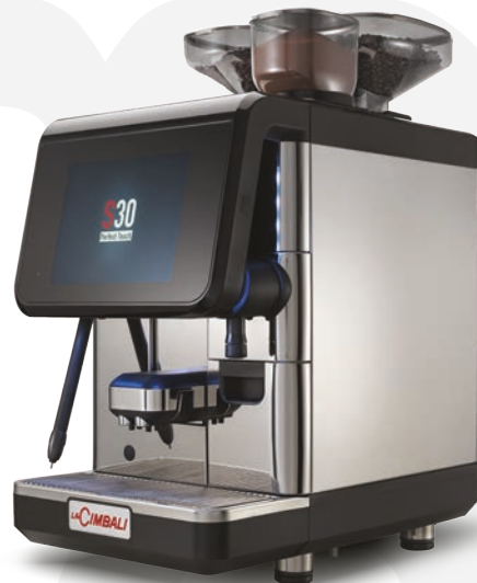
LaCimbali S30 – Front and ¾ front view

Leistungskapazität von bis zu 300 Tassen pro Tag bei gleichbleibender Qualität.