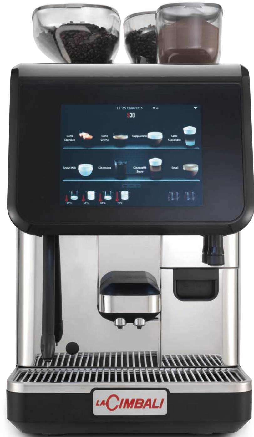
LaCimbali S30 – Vorderseite und ¾ Vorderansicht