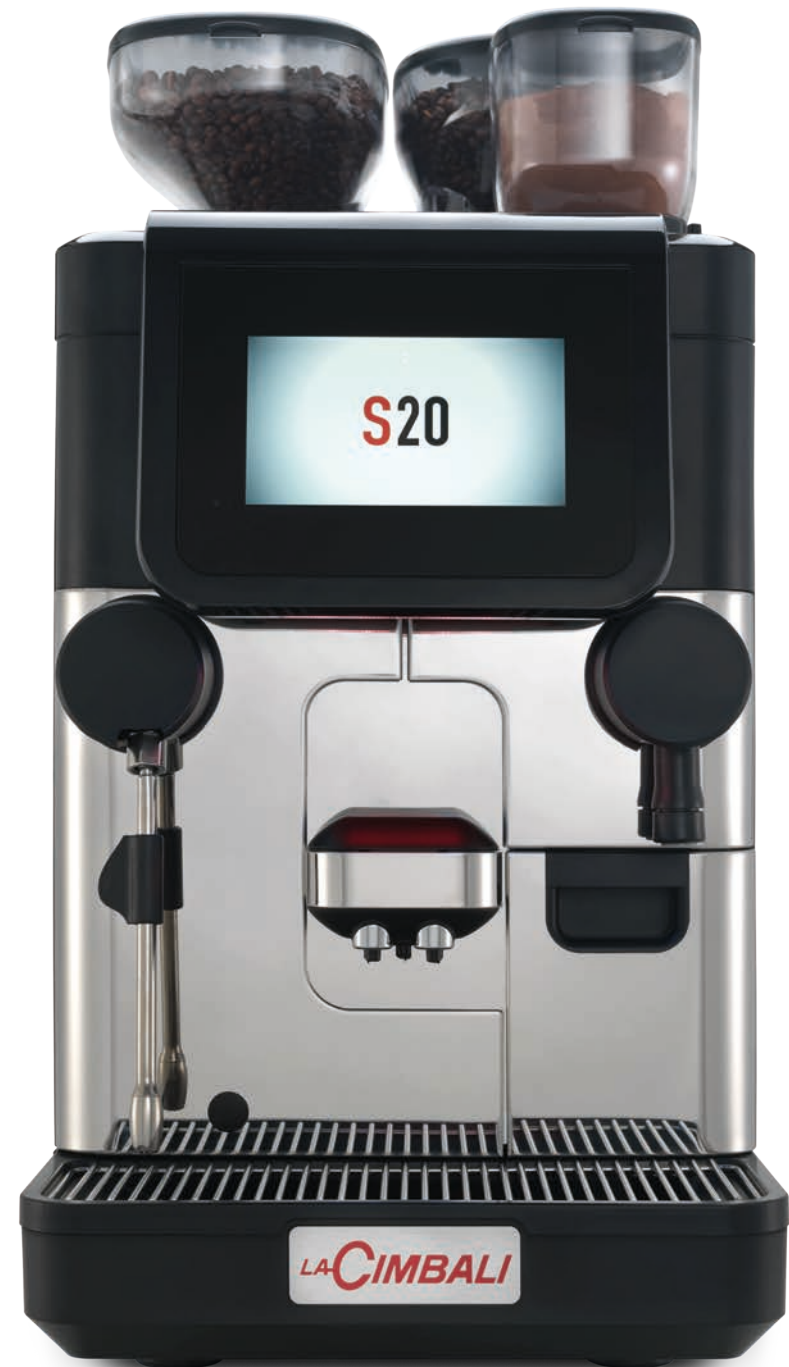
LaCimbali S20 – Vorderseite und ¾ Vorderansicht