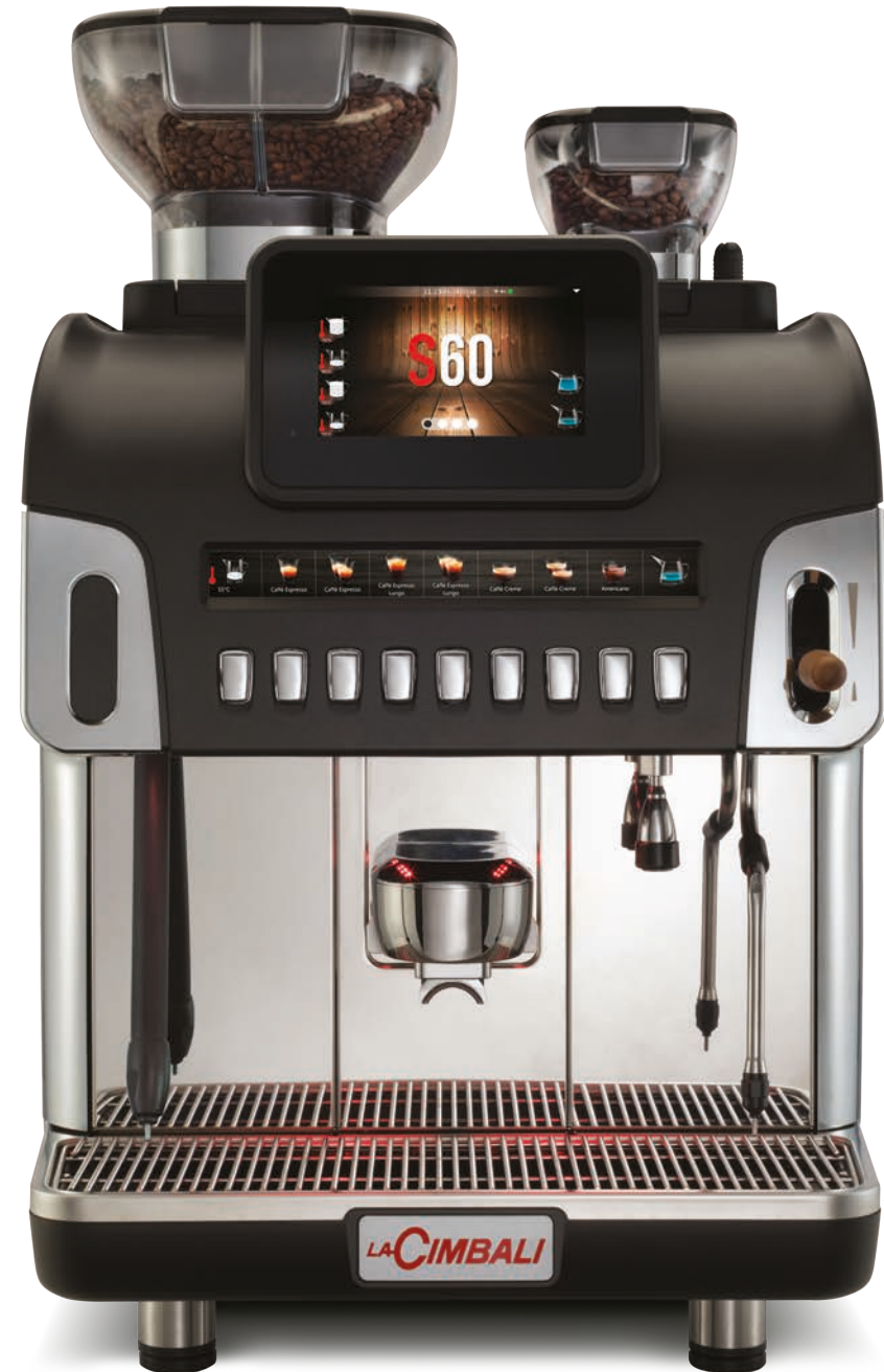
LaCimbali S60 – Vorderseite und ¾ Vorderansicht